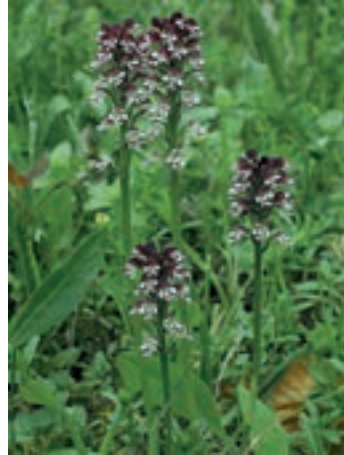
Abb. 2: Brandknabenkraut

ter den Orchideen. Wer nach der Besichtigung der Pflanzen noch Energie übrig hat, kann auf den schönen Aussichtsturm auf den Ossinger-Berg steigen und sich