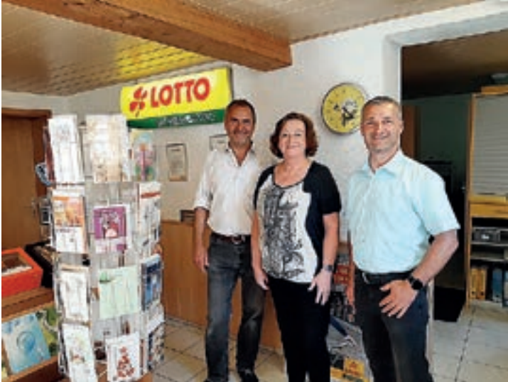
Lottoshop und Tabakwarenschop Böhm