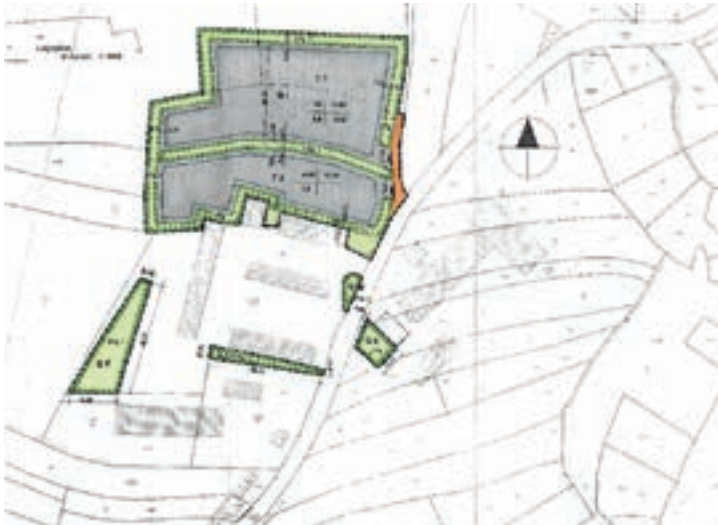
Abbildung: Lageplan mit dem Geltungsbereich des Bebauungsplans Gewerbegebiet „An der Sorger Straße“, genodet, ohne Maßstab