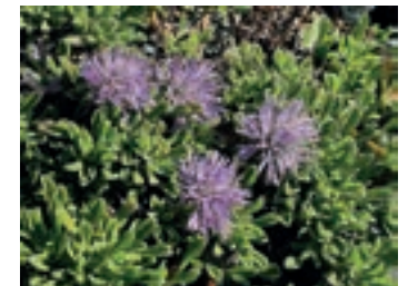
Abb. 3: Kugelblume, Globularia bellidifolia

den Farnen und ihren Begleitpflanzen. Die zierliche Staude wächst bei uns in feuchten, kühlen Wäldern mit reichlicher Humusschicht. Die blühenden Stängel werden kaum höher als 15cm, tragen zwei herzförmige Laubblätter und eine weiße Blütentraube am Ende. Die nur 4-6mm kleinen Einzelblüten besitzen eine 4-zählige Symmetrie. Aus ihnen gehen später Früchte in Form roter Beeren hervor, die leicht giftig sind. Die Art kommt im gemäßigten Mitteleuropa, Asien bis Japan vor, in den Alpen bis 1950m Höhe. Nachdem der Gattung aus der Familie der Spargelgewächse früher nur 3 Arten zugeordnet wurde, sind es nach neueren, auch genetischen Untersuchungen um