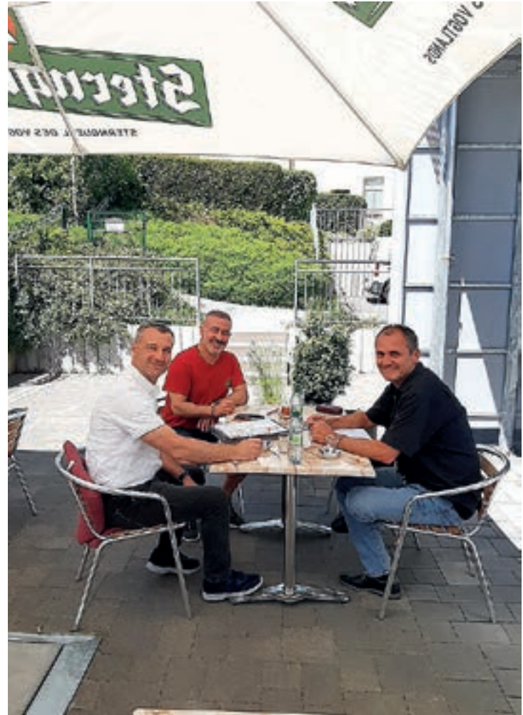
Aladin Döner mit Außenbereich

Projektvorschläge von Seiten der Wirtschaftstreibenden wie eine Aufklärungsveranstaltung zur Unterstützung der Selbständigkeit im Nebenerwerb, die bessere Bewerbung der Außenanlagen in