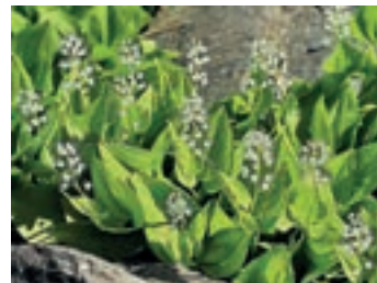
Abb. 2: Zweiblättriges Schattenblümchen, Maianthemum bifolium

nung tauchen in der Literatur mitunter verschiedene Varianten auf, wie Penstemon fruticosus ssp. scouleri , auch sind unterschiedliche deutsche Namen zu finden wie Großblütiger oder Verholzender Bartfaden. Der immergrüne Strauch stammt auch dem Westen Nordamerikas, kann bis 50cm hoch werden. Die hellen rosa-violetten Blüten werden 4-10cm lang; die Laubblätter weisen eine lanzettliche Form mit gesägtem Rand auf. Der Pflanzenstandort sollte in der Sonne bis Halbschatten liegen; bei starkem Frost im Winter ist ein Schutz ratsam. Die gesamte Gattung aus der Familie der Wegerich-Gewächse ist in ihrem Vorkommen auf Nordamerika bis Mexiko beschränkt. Kommen wir nun zu einer Art, die mit etwas Glück auch in den Wäldern des Vogtlandes zu finden