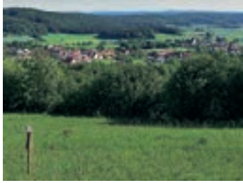
Abb. 1: Blick vom Lehrpfad auf Königstein

Mitglieder am 24. Mai dieses Jahres eine Exkursion zum Botanischen Lehrpfad bei Königstein in der Oberpfalz. Dort befindet sich auf der fränkischen Alb in ca. 600 m