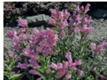
Abb.1: Strauchiger Bartfaden, Penstemon scouleri

Im Bereich der Arten aus Nordamerika blühen gleich mehrere Spezies aus der Gattung Bartfaden (Penstemon), wie der Strauchige Bartfaden, Penstemon scouleri (Abb.1). Bei der exakten Bezeich-