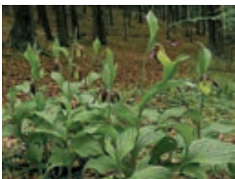
Abb. 3: Frauenschuh

Höhe ein ca. 5,6 ha großes Areal, welches seit vielen Jahren unter Schutz steht. Den geologischen Untergrund bilden Kalkgesteine. Das Gebiet umfasst Mischwälder mit hohem Buchenanteil, Hecken, Wiesen und Halbtrockenrasen mit einer sehr artenreichen Vegetation, die viele seltene Spezies enthält, welche besondere ökologische Bedingungen erfordern. Zu ihnen gehören u.a. viele Orchideenarten, von denen wir allein neun in Vollblüte oder Knospenstadium beobachten konnten. Dazu gehören z.B. die Grüne Hohlzunge, das Brandknabenkraut, das Stattliche Knabenkraut, die Korallenwurz und der nicht zu übersehende Frauenschuh, welcher die größten Blüten unter unseren einheimischen Orchideenarten hervorbringt. Aber auch andere interessante Arten blühen dort, wie Akelei, Großes Windröschen, Sonnenröschen, Salomonssiegel, Wiesenknopf, Einbeere, Diptam und viele andere