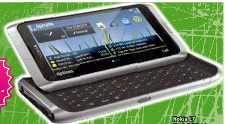
Nokia E7 Modell E7-00